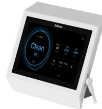
Possibilité de montage sur des surfaces murales